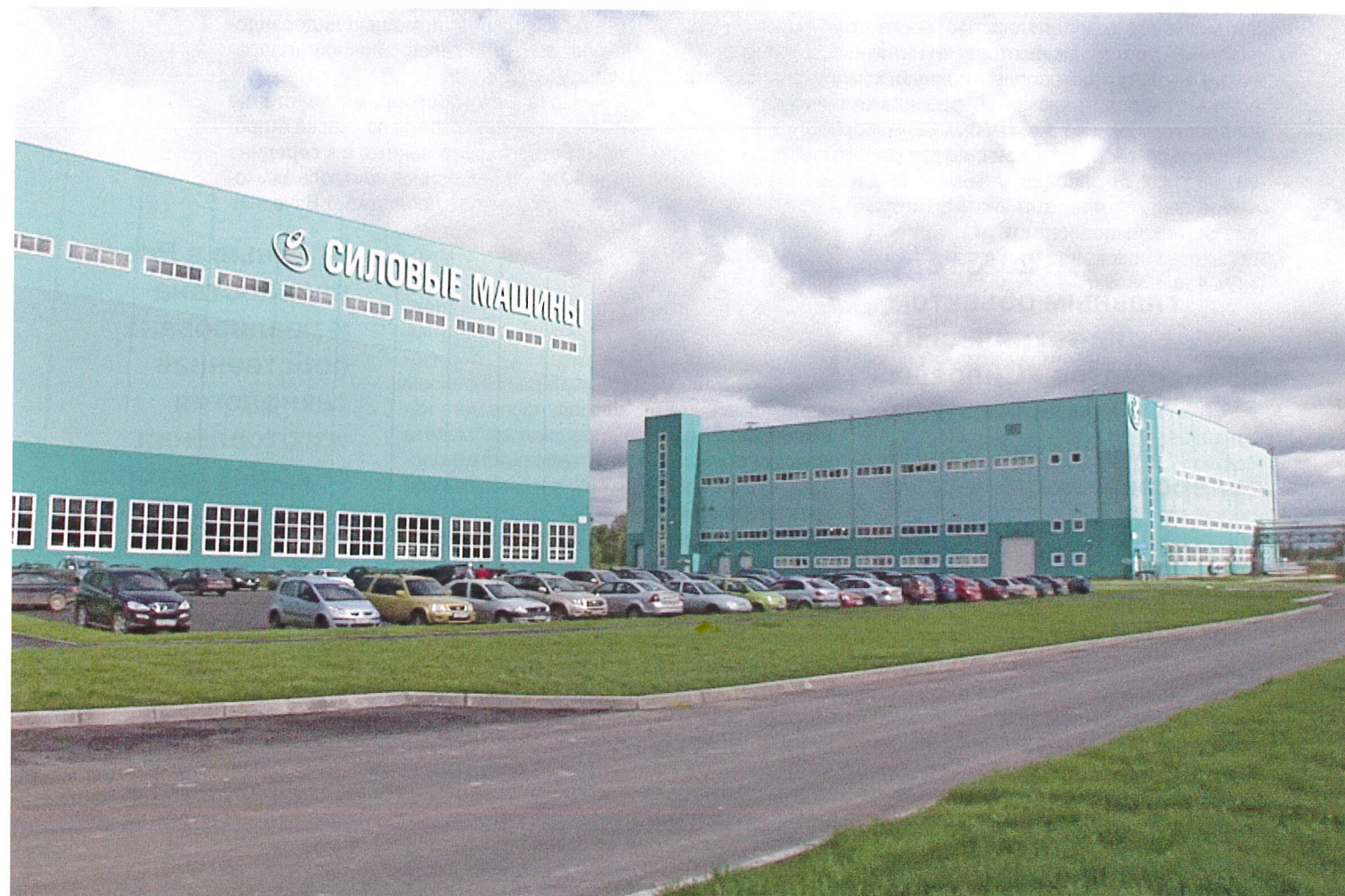
Первый пусковой комплекс нового завода в Металлострое

«Силовые машины» поставили перед собой амбициозную задачу создания и внедрения в России технологии сварки роторов своими силами, чтобы встать в один ряд с крупными мировыми производителями турбинного оборудования, обладающими подобной технологией.